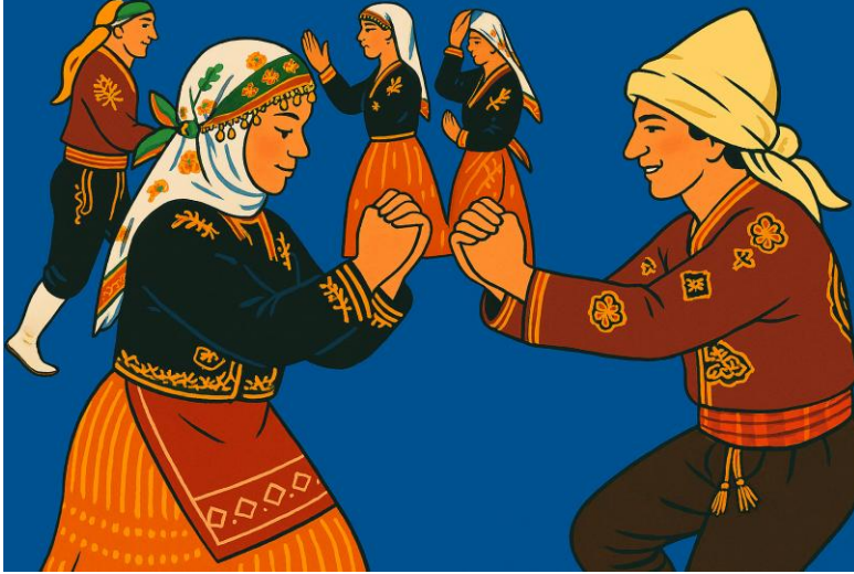
Figür 2 Yayık Yayma