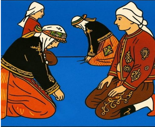
Figür 3 Hamur Yoğurma