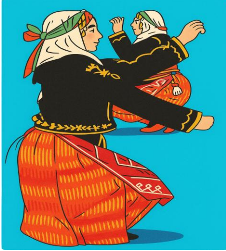
Figür 1 İnek Sağma